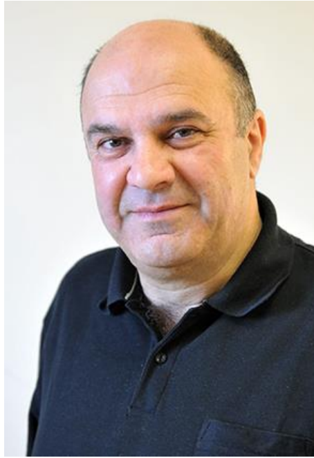
Рис. 6. Шмуэль Шапиро

Профессор Шмуэль Шапиро, ведущий ученый при израильском правительстве, сказал, что этот тип исследований должен быть запрещен, поскольку он играет с огнем.