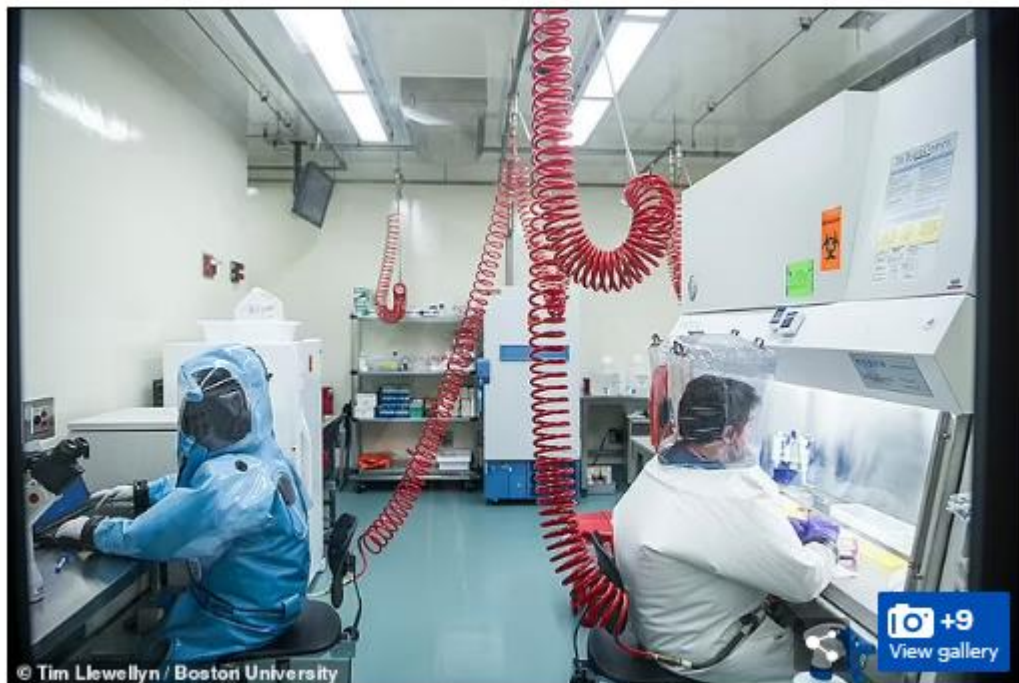
Boston University's National Emerging Infectious Diseases Laboratories is one of 13 biosafety level 4 labs in the US