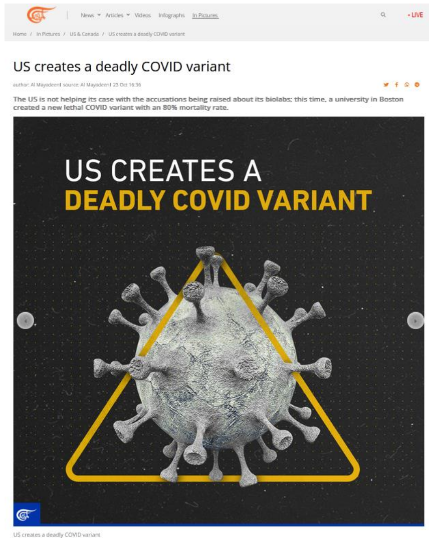
Рис. 8. Публикация на сайте ливанского телевизионного канала «Аль-Маядин» «США создает смертельный вариант COVID»