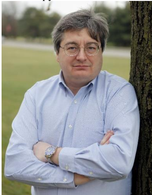
Рис. 5. Ричард Х. Эбрайт

Доктор Ричард Х. Эбрайт, американский молекулярный биолог и химик из Университета Ратгерса (США), заявил, что это исследование может спровоцировать следующую пандемию, созданную в лаборатории, т.к. были усилены патогенные свойства вируса.