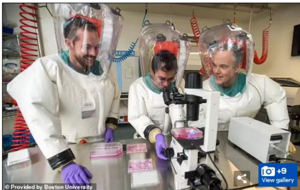
Full-body, air-supplied pressure suits are worn and workers must change their clothing before entering and shower before leaving

Рис. 2. Публикация на сайте британской газеты Daily Mail (фотографии из Национальной лаборатории по исследованию перспективных инфекционных заболеваний Бостонского университета)