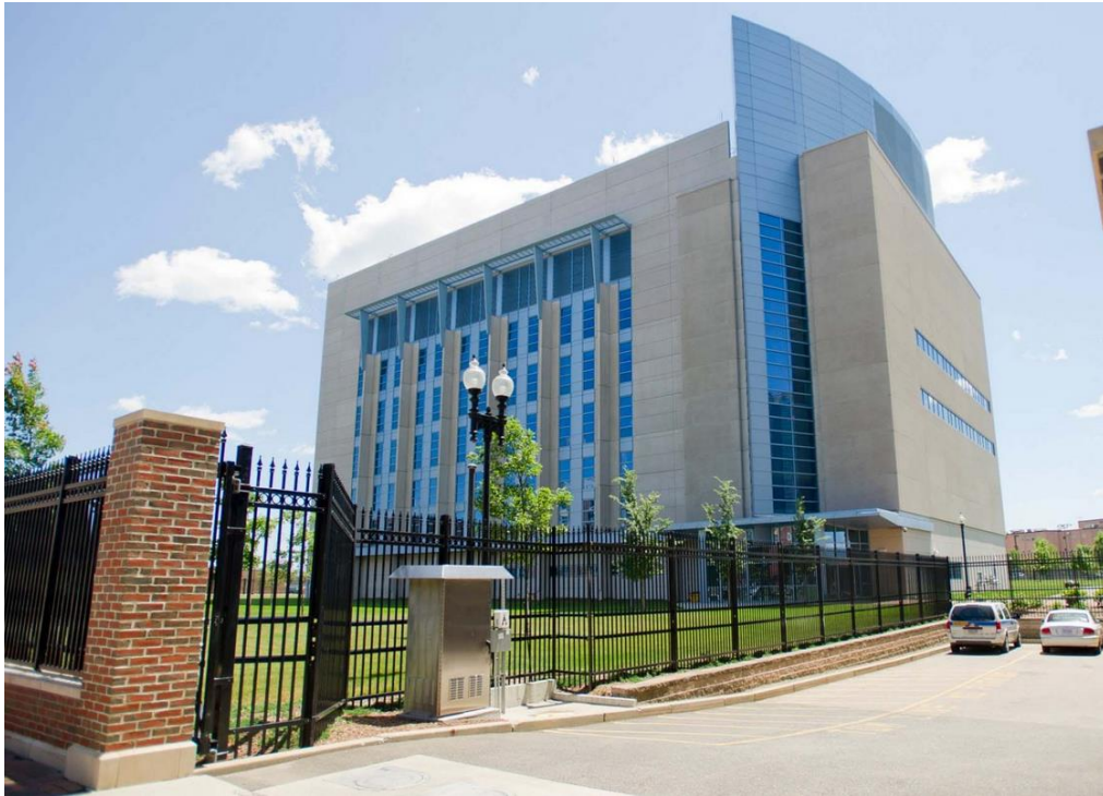
Рис. 4. Национальная лаборатория по исследованию перспективных инфекционных заболеваний Бостонского университета

Доктор Ричард Х. Эбрайт, американский молекулярный биолог и химик из Университета Ратгерса (США), заявил, что это исследование может спровоцировать следующую пандемию, созданную в лаборатории, т.к. были усилены патогенные свойства вируса.