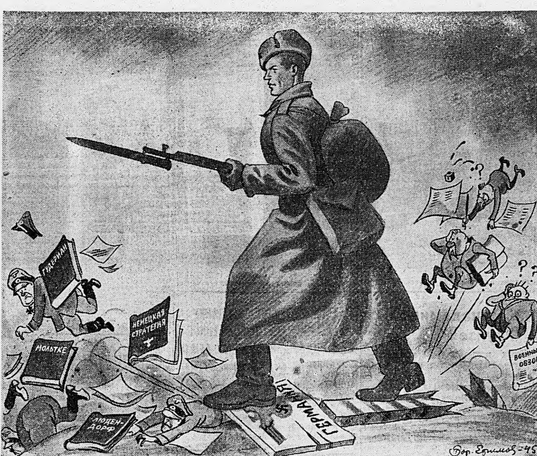
Рис. Бор. Ефимова.

БОМБАРДИРОВКА БЕРХТЕСГАДЕНА. ЛОНДОН, 22 февраля. (ТАСС). Агентство Рейтер передает сообщение штаба средиземноморских сил союзников о том, что 20 февраля впервые с начала войны был подвергнут бомбардировке Берхтесгаден — сельская резиденция Гитлера. В бомбардировке приняли участие средние бомбардировщики и истребители-бомбардировщики, входящие в состав средиземноморской авиации союзников.