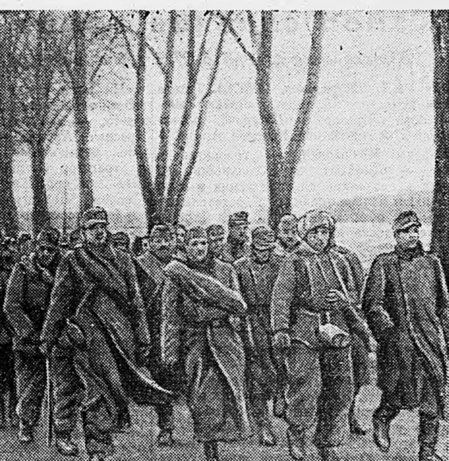
Снимки Ильи Эренбурга.